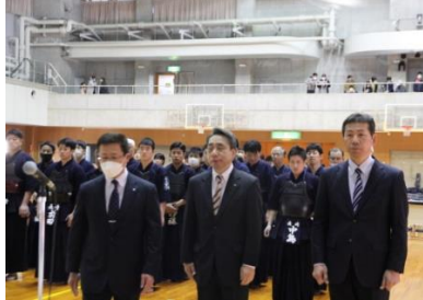
少年剣道教育奨励賞