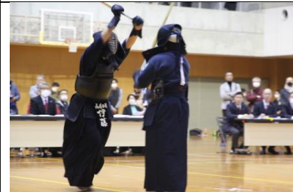
紅白試合⑤ 剣道 高校生の部