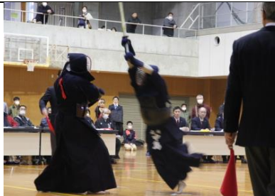
紅白試合⑥ 剣道 一般の部