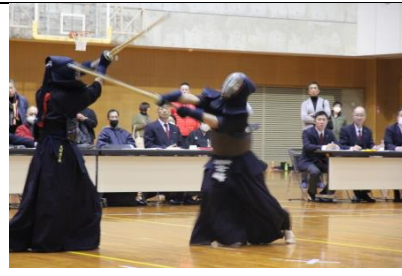
紅白試合④ 剣道 中学生の部