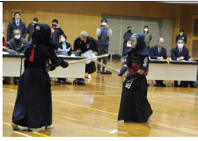
紅白試合③ 剣道 小学生の部