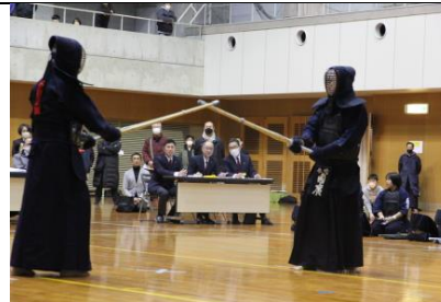
紅白試合⑦ 剣道 大将戦