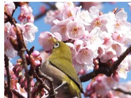
写真：新宿御苑の寒桜と鶯

居合道の稽古にも優しい季節が近づいてきています。このような時こそ自己研鑽を究めていきたいものです。