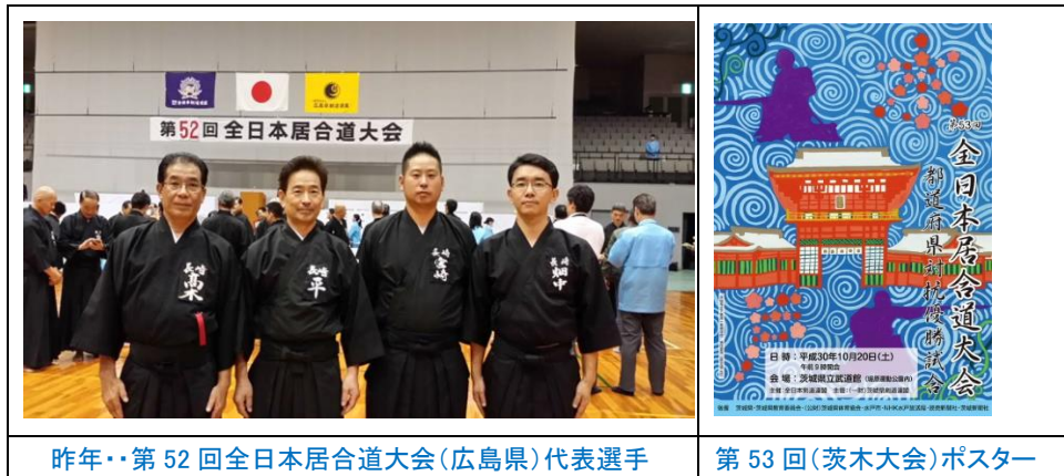
昨年・第 52 回全日本居合道大会 (広島県) 代表選手

五段、六段、七段の都道府県代表選手がトーナメント方式で古流 2 本 (自由技)、全日本剣道連盟居合 3 本 (指定技) の計 5 本の技で対戦し、各段の個人のポイント合計が団体の総合成績で戦います。本県からは 7 月 1 日 (日) に大村市武道館で開催される県下居合道選手権で上位入賞した五段から七段の各 2 名を全日本強化選手として強化稽古を行い、代表選手を選考し決定します。選考された選手は長崎県代表として上位入賞ができるように昨年の広島県大会の結果 47 都道府県中、団体 11 位 (6.17 点) の結果を踏まえ、今後とも長崎県剣道連盟居合道部としての活躍を望みたいと思います。