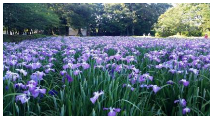
写真1：大村公園の花菖蒲が満開です

梅雨は陰暦五月に降り続く長雨のことで、五月の水垂れから、「さみだれ」と呼ばれています。梅雨の合間に見える晴天が五月晴れ。6月6日(水)の芒種は二十四節気の中でも夏の節気で稲など(穂)のある穀物の種まきの頃です。この頃に咲く紫陽花はアジサイ科の植物です。花がさまざまな色になることから、「八仙花」や