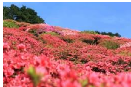
写真1：佐世保の長串山にはツツジが満開

5月6日頃(平成30年は5月5日)。および小満までの期間を言います。穀雨から数えて15日目ごろ。夏も近づく「八十八夜」の3、4日後。春分と夏至のちょうど中間にあたります。暦の上での夏の始まり。この日から立秋の前日までが夏季になります。季節のことばでは「夏が立つ」と言い、いよいよ夏が来ましたという意味があります。