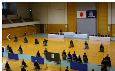
写真 4：居合道八段審査会(京都)